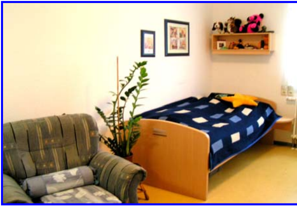
- Bewohnerzimmer -