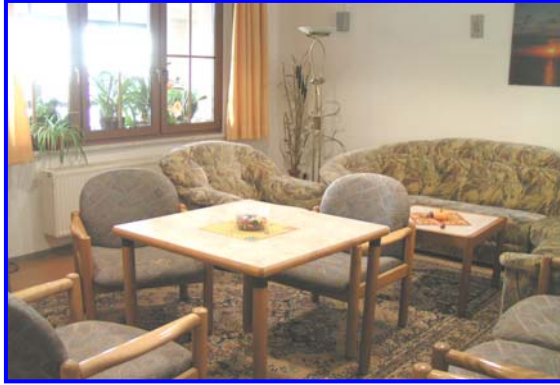
- Aufenthaltsbereich -