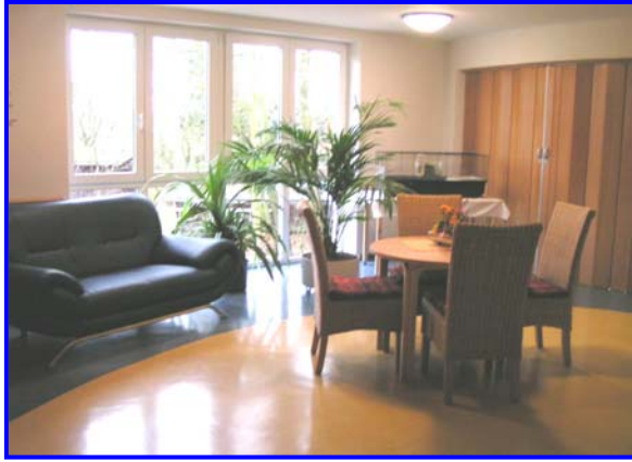
- Aufenthaltsbereich -