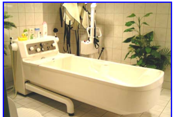
- Pflegebad -