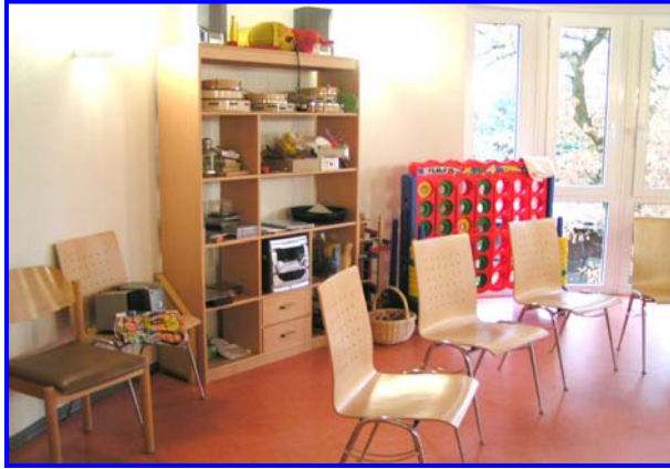
- Therapieraum -