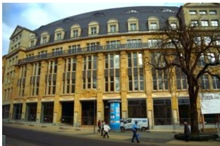
Die Außenfassade am Postplatz ist fertig.

Im Dachgeschoss muss die Höhe der Treppen angepasst werden. Es entstand im Bereich des zukünftigen Katasteramtes auch ein barrierefreier Zugang. Auch im gesamten Haus ist die Barrierefreiheit gewährleistet-