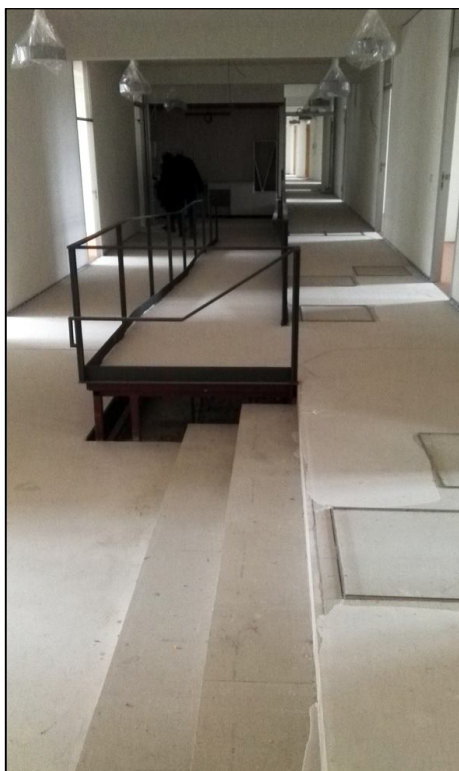
Im Altbau zum Postplatz sind die Räume fast einzugsbereit.