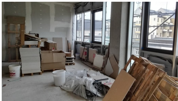
Im Neubau Rädelsstraße ist der Innenausbau im vollen Gange