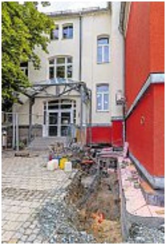
Trockenlegung im Bereich des Kellergeschosses der Parkschule Auerbach.

Während viele vogtländische Schülerinnen und Schüler sowie deren Familien die Sommerferien für Erholung und Urlaub nutzten, liefen an den kreiseigenen Schulen die Neubau- und Sanierungsarbeiten auf Hochtouren. Mit den Planungen für die Arbeiten an den kreiseigenen Einrichtungen hat das im Landratsamt zuständige Amt für Gebäude- und Immobilienmanagement bereits in der ersten