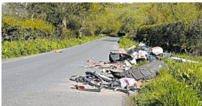
Solcherart illegaler Ablagerungen nehmen auch im Vogtlandkreis zu.

Grüngut, Baumischabfälle, Bauschutt, Sperrmüll (bestimmte Mengen und Arten), Gewerbeabfall/gemischter Siedlungsabfall, Reifen, Gipskarton und Flachglas können kostenpflichtig entsorgt werden.