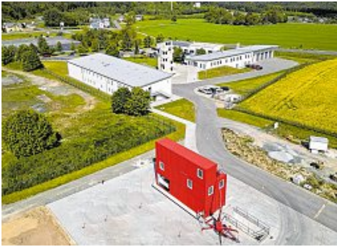
Blick auf das neue Brand- und Katastrophenschutzzentrum vor den Toren der Stadt Treuen.

Tag der offenen Tür am 13. September gibt Einblicke in Ausbildung für Brand- und Katastrophenschützer