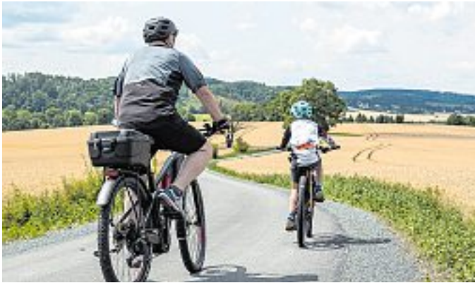
Und endlich gehts bis an die Talsperre Pirk. Das letzte Teilstück des Radweges nahe der „Neuen Welt/Dobeneck“ ist fertig gestellt.

Anfang des Jahres war der Weiterbau beschlossen worden, im Februar starteten die Bauarbeiten und im Juli war es geschafft: Ein weiteres Teilstück des Elsterradweges im Vogtland konnte übergeben werden. Die etwa 750 Meter lange Strecke zwischen der S 311 „Neue Welt“ und Dobeneck ist in diesen Tagen fertiggestellt und für den Radverkehr freigegeben worden.