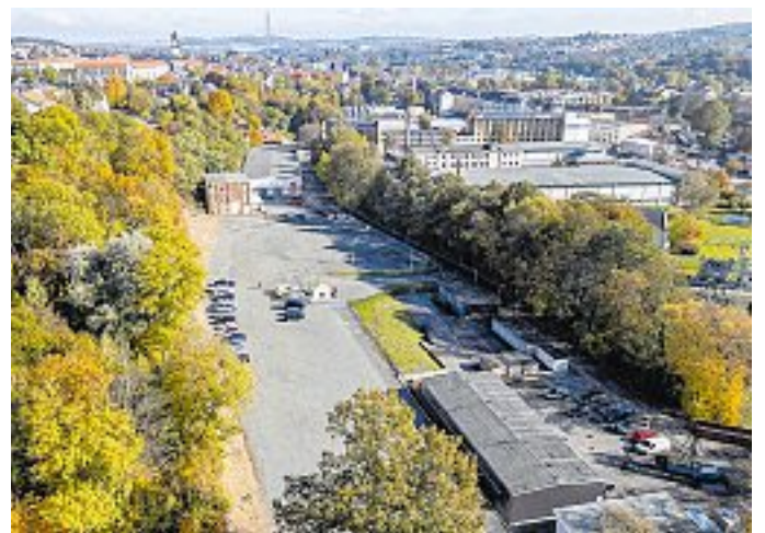
Zentral und doch infrastrukturell hervorragend gelegen: das Gewerbegebiet „Am Mühlgraben“.

Top-Lage, hervorragende innerstädtische und Landkreis-Anbindungen. So präsentiert sich das Gewerbegebiet „Am Mühlgraben“ unweit des Beruflichen Schulzentrums e.o.plauen.