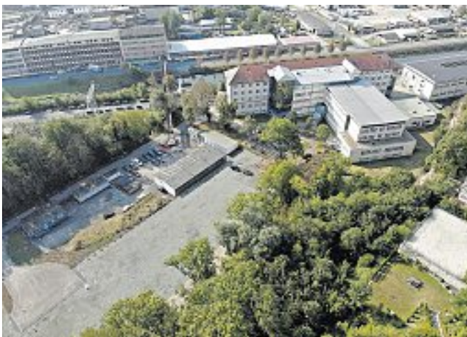
Viel Platz für mögliche Investoren und noch dazu in exponierter Lage.

Der Obere Bahnhof Plauen sowie der Busbahnhof sind in ca. 2 km Entfernung erreichbar.