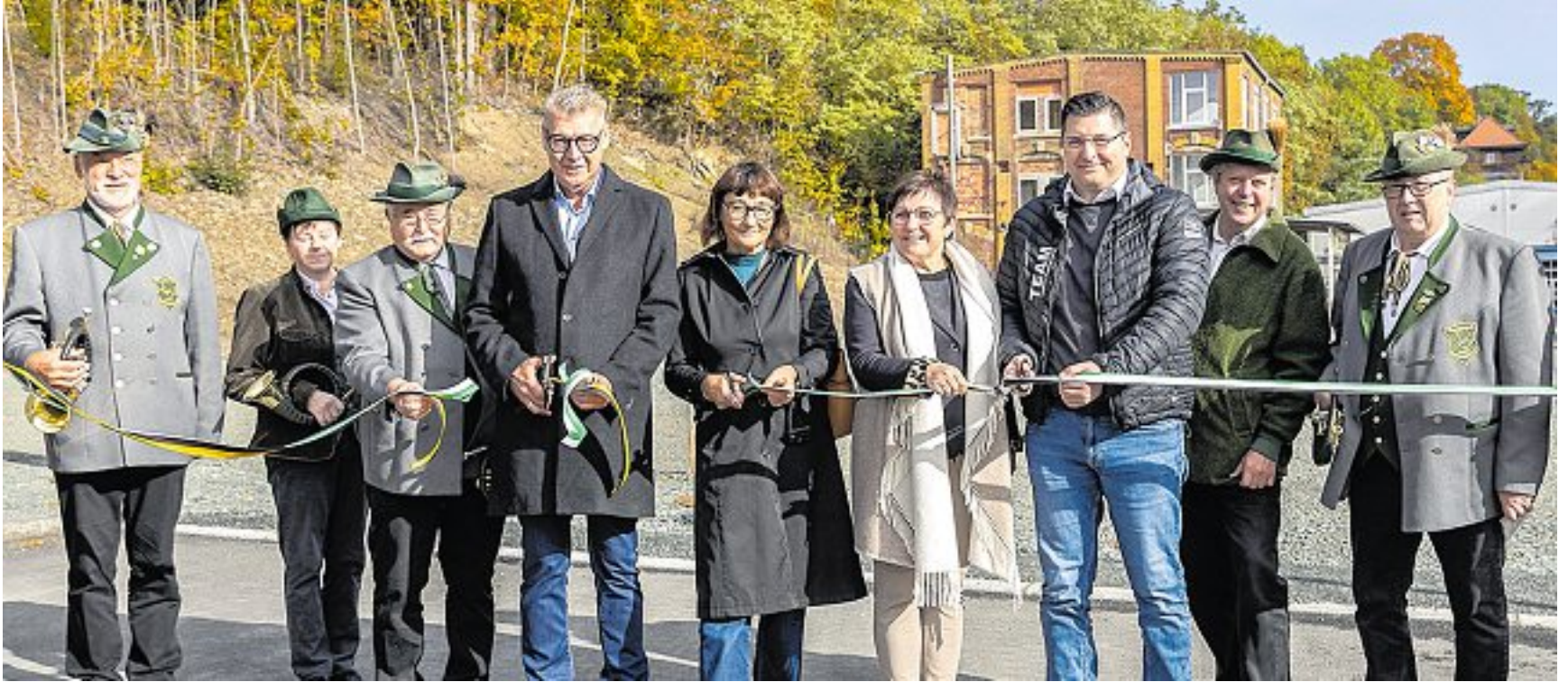
Offizielle Freigabe der Bebauungsflächen am Mühlgraben in Plauen.