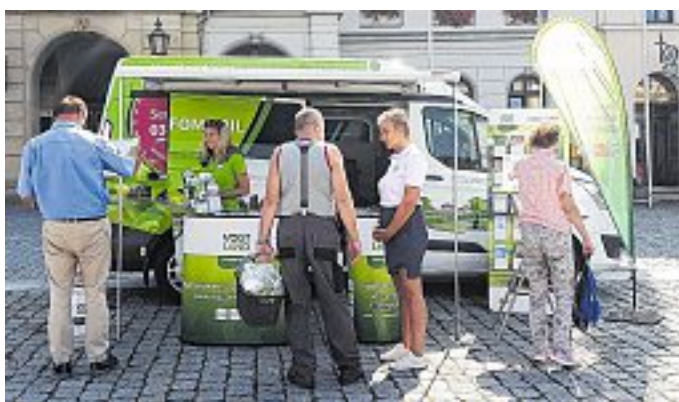
VV-Infomobil für Sie persönlich vor Ort.

Lassen Sie sich beraten, holen Sie sich hilfreiche Tipps und entdecken Sie neue Möglichkeiten, das Vogtland mit Bus und Bahn zu erleben. Das VV-Team freut sich auf Ihren Besuch!