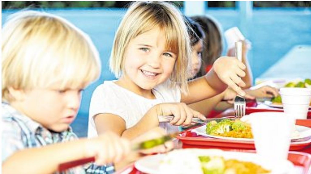
Umfrageergebnis: Die Qualität des Essens ist in vielen Kita-Einrichtungen besser als gedacht.