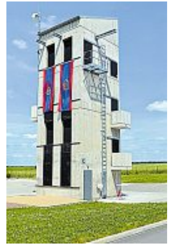
Überragt mit 16 Metern Höhe das Areal. Der Übungsturm.

Was lange währt, wird gut, weiß der Volksmund. Im Falle eines der größten Investitionsvorhaben des Vogtlandkreises in den letzten Jahren erst recht. Das Brand- und Katastrophenschutzzentrum (im Weiteren als Zentrum bezeichnet) Eich eröffnet am 13. September im Rahmen eines Tages der offenen Tür und stellt sich den interessierten Bürgern und Feuerwehrleuten der Region vor.