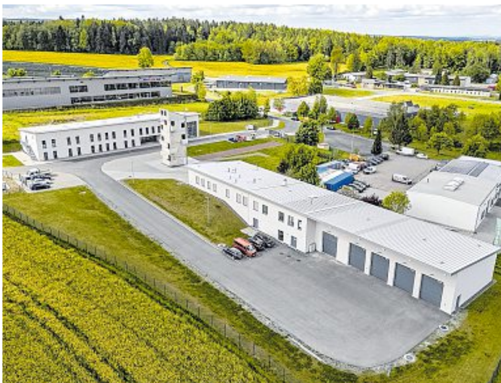
Der weithin sichtbare über 16 Meter hohe Übungsturm (Bildmitte) wird von einem Brandhaus (links) und zahlreichen Trainingsflächen umrahmt.

Mit einem fast ganztägigen Programm (lesen Sie dazu auf Seite 11 dieser Ausgabe) feiern die Brand- und Katastrophenschützer des Vogtlandkreises mit den Gästen ihr neues Ausbildungs- und Trainingsdomizil. Und genau das hat es in sich. Das weitläufige Areal wird demnach gleichzeitig ein bedarfsgerechtes Zentrum für Kinder- und Jugendfeuerwehren wie auch ein zentraler Ort für die moderne Aus- und Fortbildung aller Feuerwehren im Vogtlandkreis sein. Es steht dann den mehr als 4.500 Kameraden der Feuerwehr sowie den Helfern der drei Einsatzzüge des Landkreises zu Übungs-